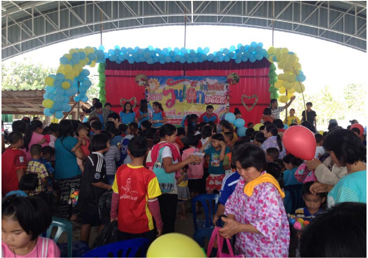
๓.๑๑ โครงการฝึกอบรมส่งเสริมพัฒนาการเด็ก