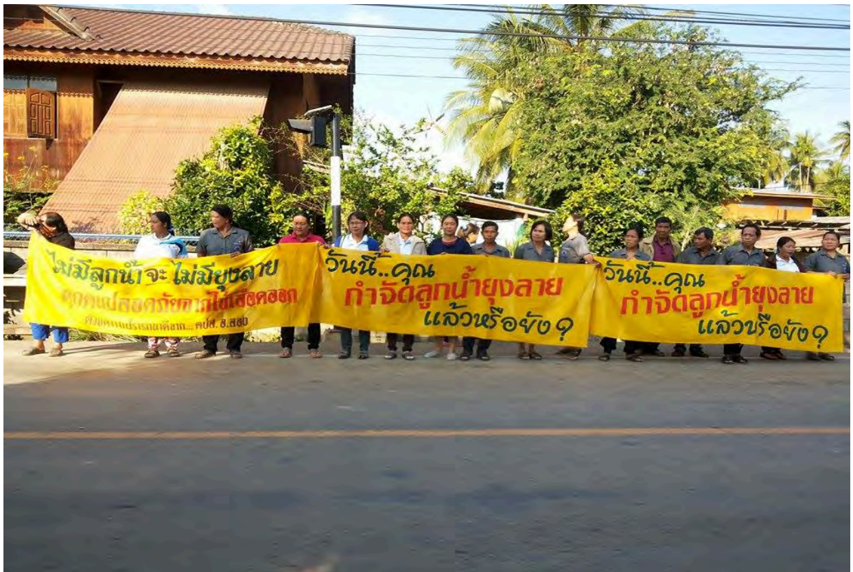
ใช้งบประมาณ ๑๐๐,๐๐๐ บาท